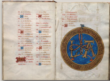
Heures LVB, couture indiquant le milieu d'un cahier (ff. 4v-5)