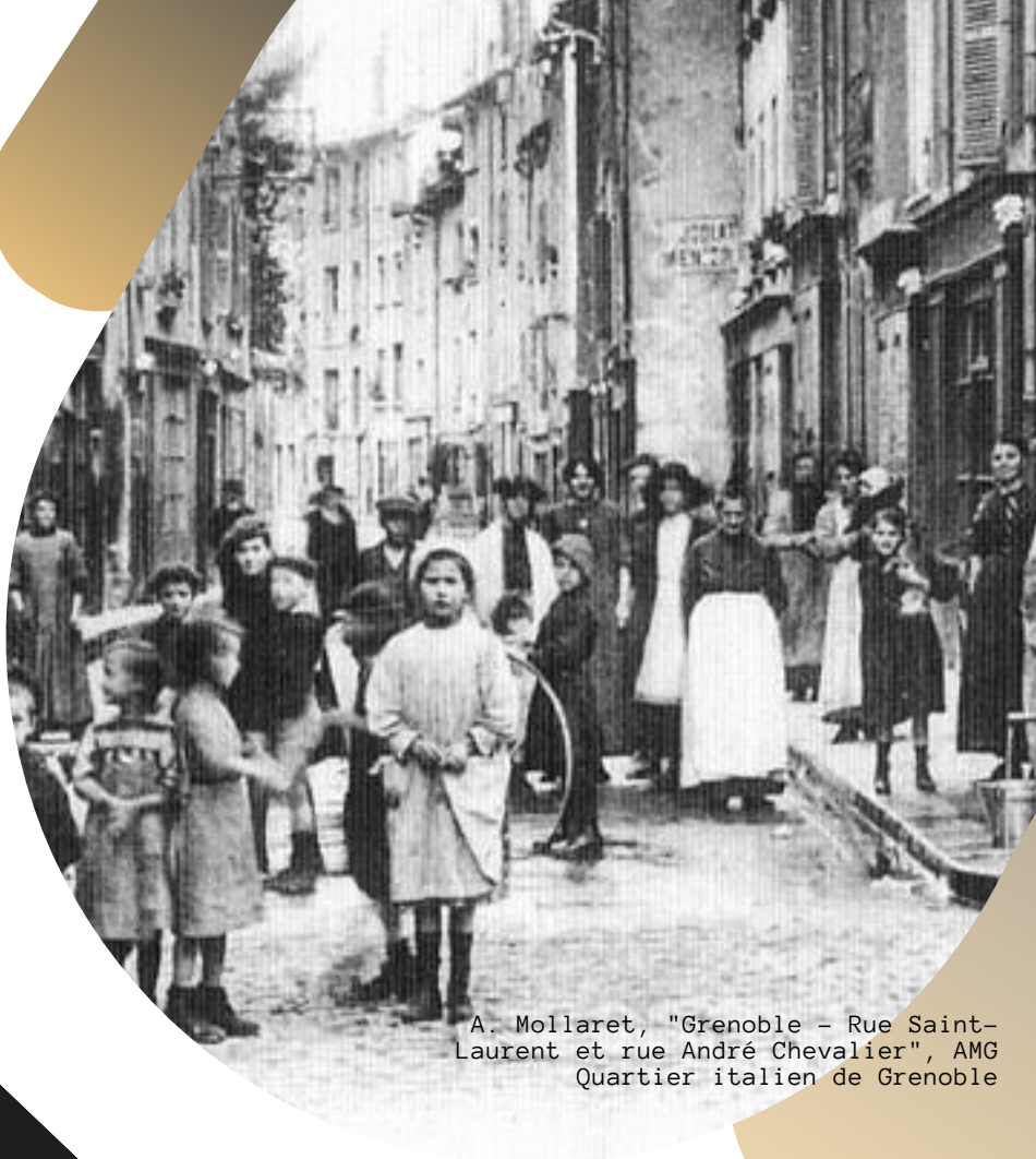
A. Mollaret, "Grenoble - Rue Saint-Laurent et rue André Chevalier", AMG Quartier italien de Grenoble