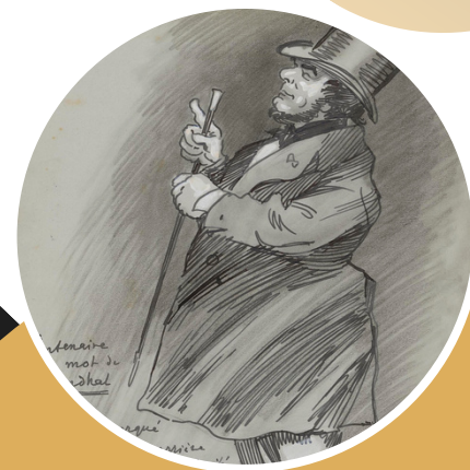
Ferdinand Bac, "Le centenaire d'un mot de Stendhal", 1881.

Assemblée générale, CR Tripartite, pique-nique républicain, ateliers agrégation et atelier LEA