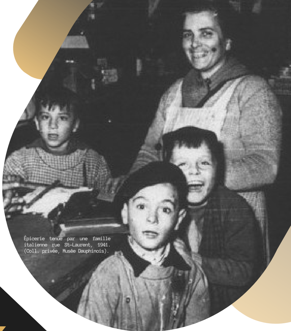
Épicerie tenue par une famille italienne rue St-Laurent, 1941. (Coll. privée, Musée Dauphinois).