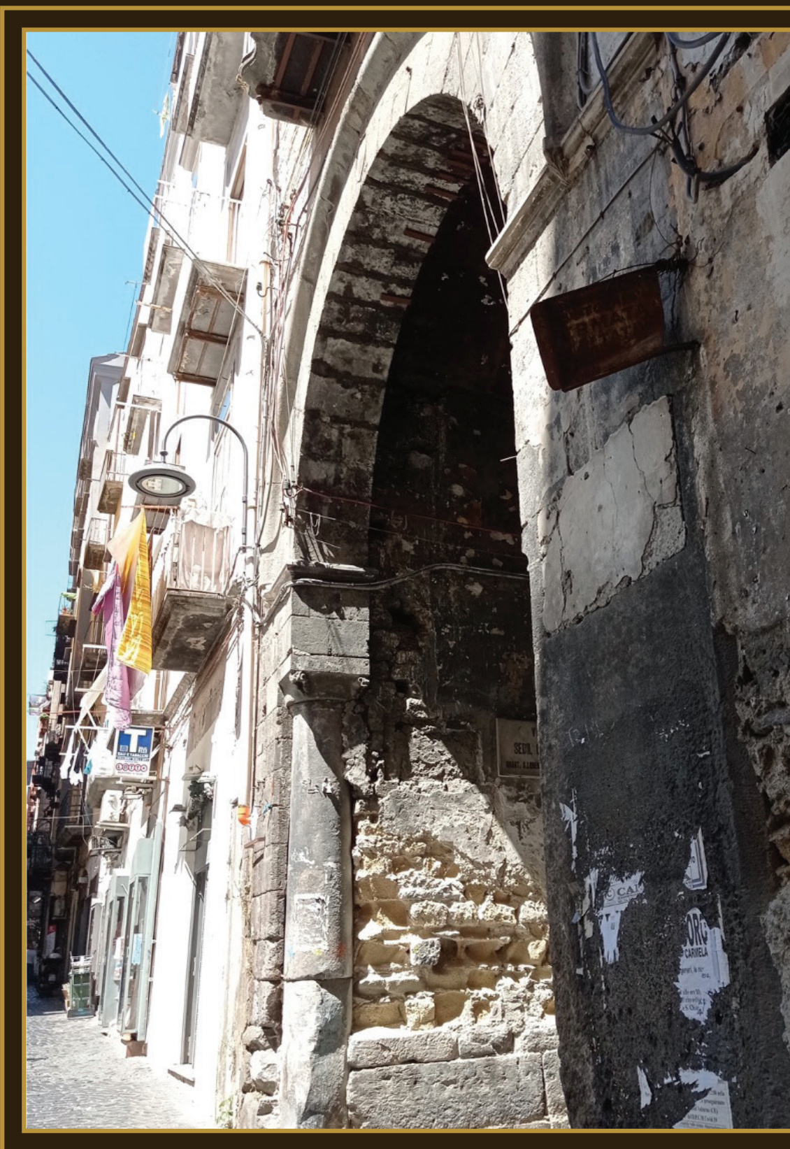
Naples, carrefour entre la platea mediana (aujourd'hui Via Tribunali) et Vico Sedil Capuano avec les vestiges du Sedile Capuanae de la moitié du XV e siècle

Bâtiment Michel Dubois Salle de conférence Annie Génovèse Domaine Universitaire